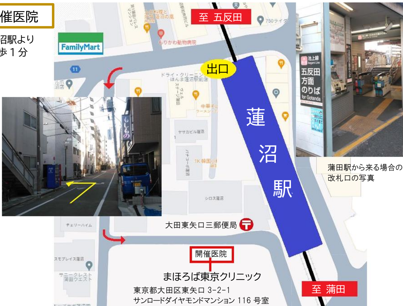
蒲田駅から来る場合の 改札口の写真

時間：10:30～16:30（10 人限定）※申込みフォームから時間帯を選んでください。